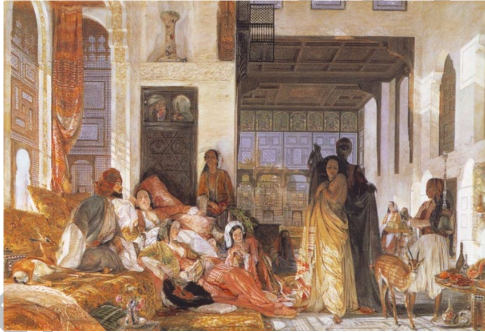
Resim 5.1. John Frederick Lewis, “The Harem- Harem, 1860

şekillendirilirken aynı zamanda etkileme, değiştirme veya yeni genel tutumlar yaratma gücüne de sahipti. Bunun nedeni, reklamlar, çizgi filmler ve filmler gibi popüler kültür nesnelerinin, mesajlarını iletmek için Oryantalizmden güçlü bir şekilde yararlanarak Oryantalist görüşü pekiştirmesidir. Tüm oryantal temalar arasında, doğulu kadınların egzotik tasvirleri tartışmalı bir şekilde farklıdır ve kurgulanmış, insanlıktan çıkarılmış doğunun en çıplak ve açık tasvirleridir. Mahrem mekanlar elbetteki yalnızca Doğu medeniyetine ait yaşam ve paylaşım alanları değildi ancak bu medeniyeti bu derece merak unsuru haline getirmelerinde katkıları büyüktü.