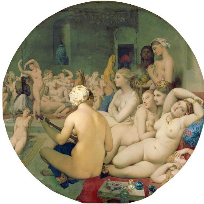
Resim 5.2. Jean-Auguste-Dominique , “The Turkish Bath-Türk Hamamı”, 1862

hanımefendi ve genç kadına çekiliyor. Kıvrımlı omuzlarından sarkan siyah cüppeleri vardır ve hatta onları çıkarmak isteyebilirler. Kambur omuzlarından sarkan siyah cüppeleri var ve belki de onları çıkarmak bile istiyorlar. Cariyenin örtüsünü açan siyahi adam bir köleydi ve Osmanlı döneminde kölelerin hiyerarşinin en altında yer aldığı ve genellikle hadım oldukları varsayılır.