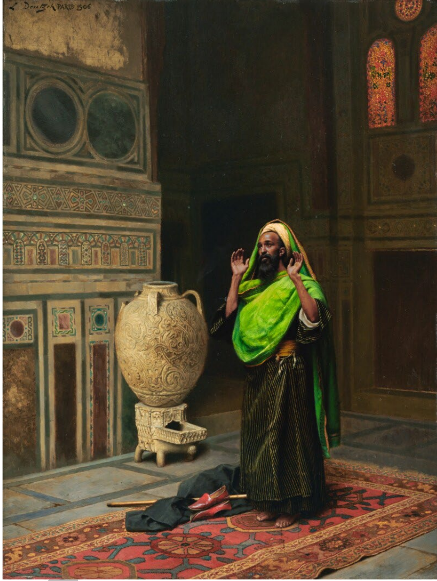
Resim 5.3. Ludwig Deutsch, “The Morning Prayer – Sabah Namazı, 1906

NOT: Bu ön baskı, hakem/bilirkişi tarafından onaylanmamış yeni arařtırmaları bildirir ve bu alanda birden fazla uzmana danıřılmadan kaynak bilgi olarak kullanılmamalıdır.